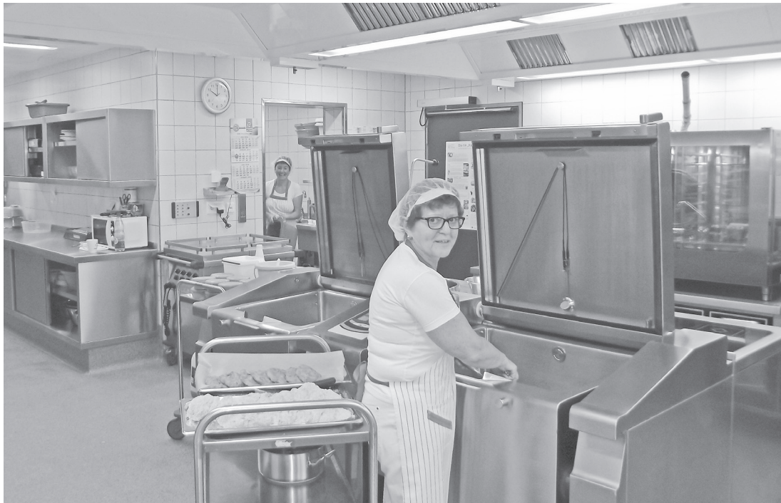
Herzstück des generalsanierten Seniorenheimes in Berching ist die Küche. Sie ist mit modernster Technik ausgestattet.